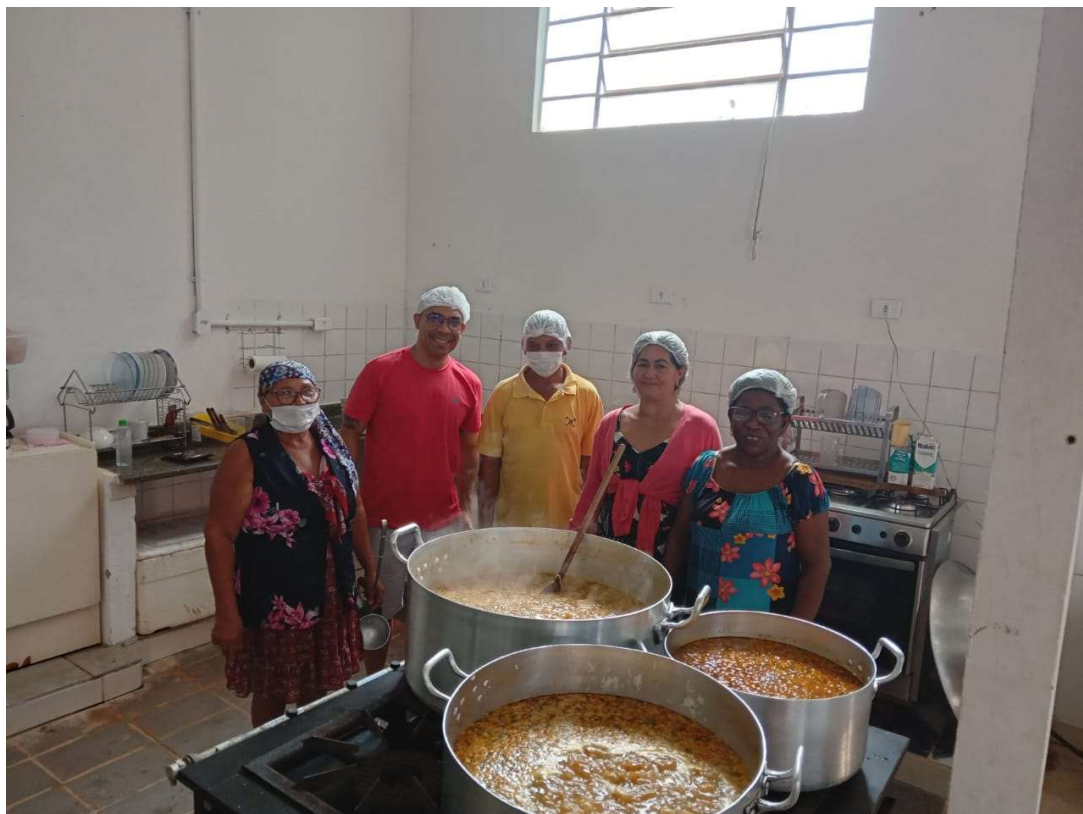
Equipe da cozinha