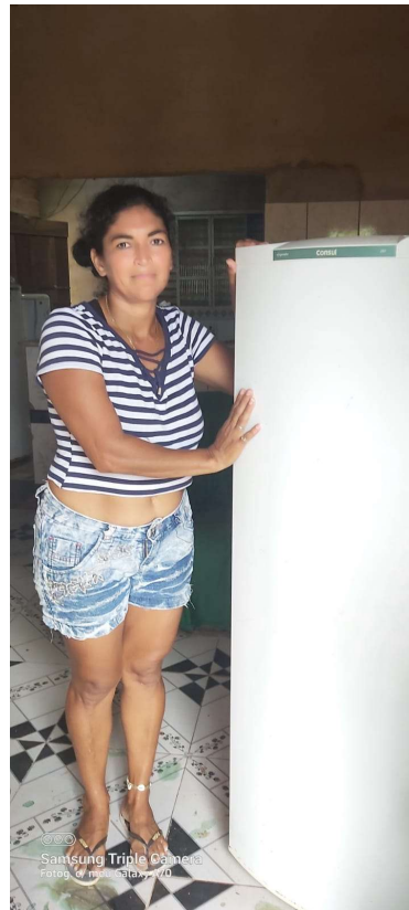
Doação de bens