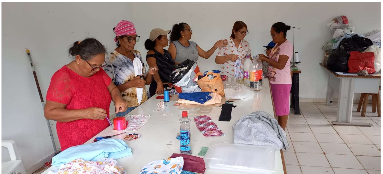
Oficina de costura