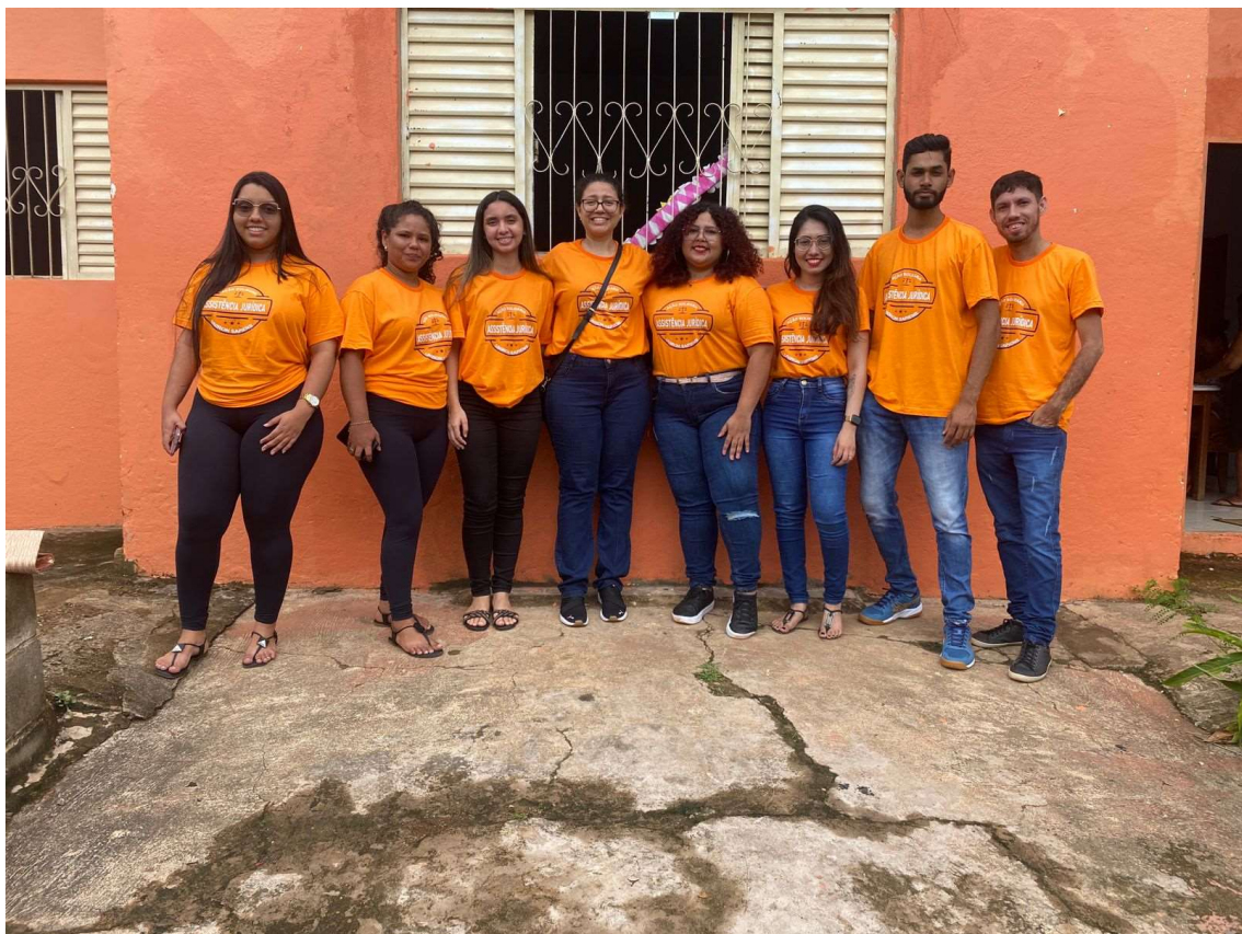
Equipe do Atendimento jurídico