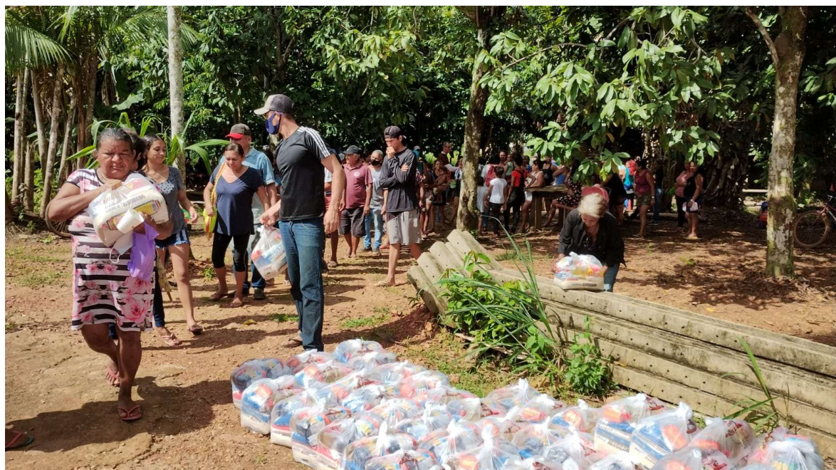
Doação de cestas básicas