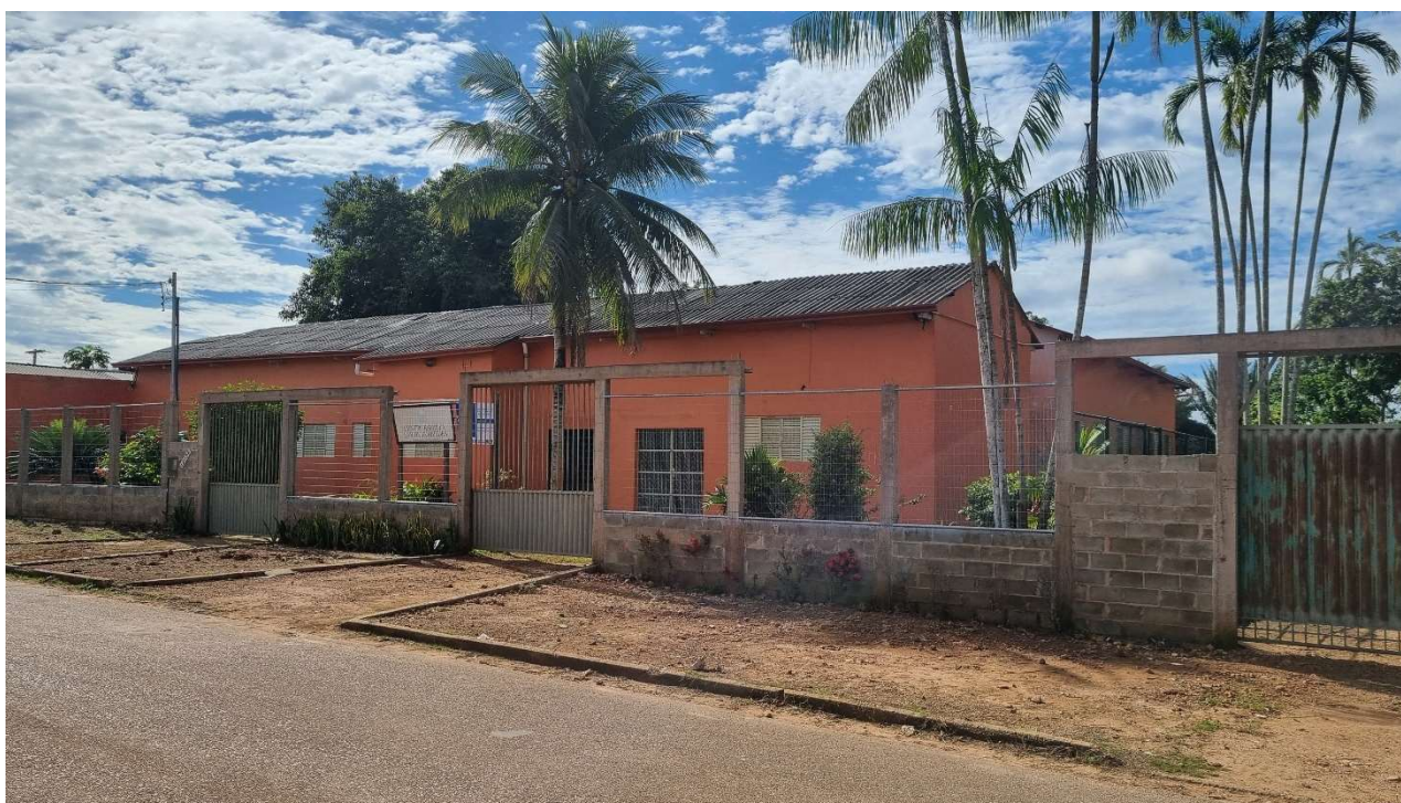
Sede da FUNNEB na Rua Canindé, 12.056