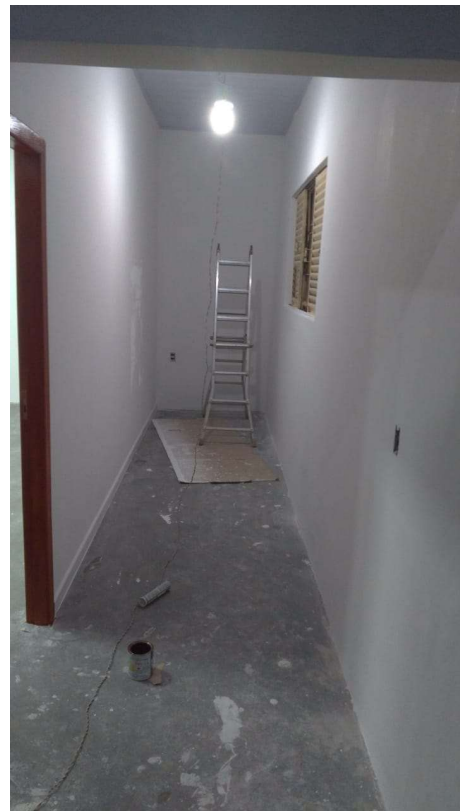
Grupo operacional de manutenção e pequenas reformas