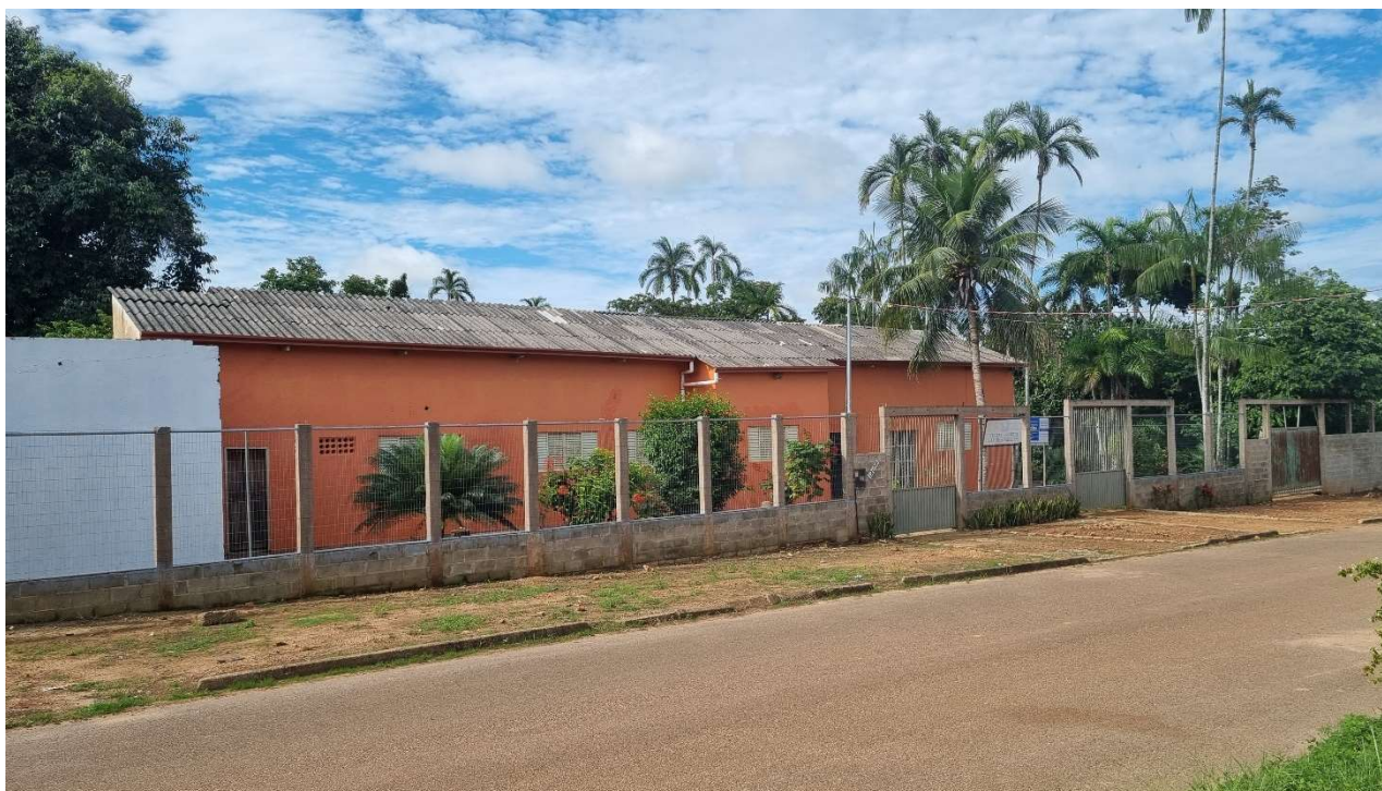
Séde da FUNNEB na Rua Canindé, 12.056