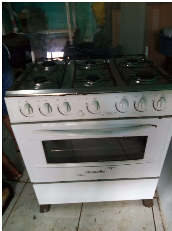
Doação de bens