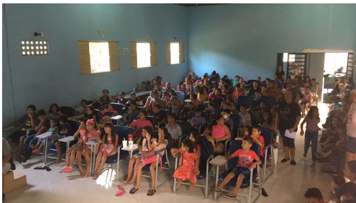
Teatro para crianças no salão multi-uso