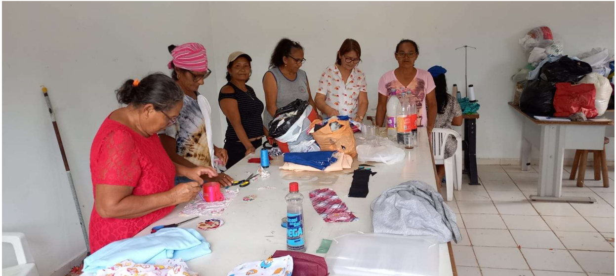
Oficina de costura