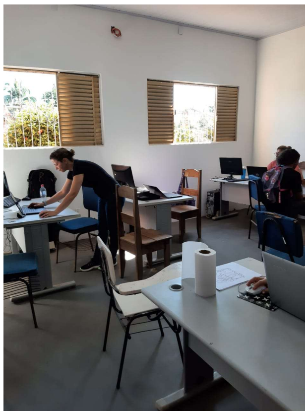
Sala de informática