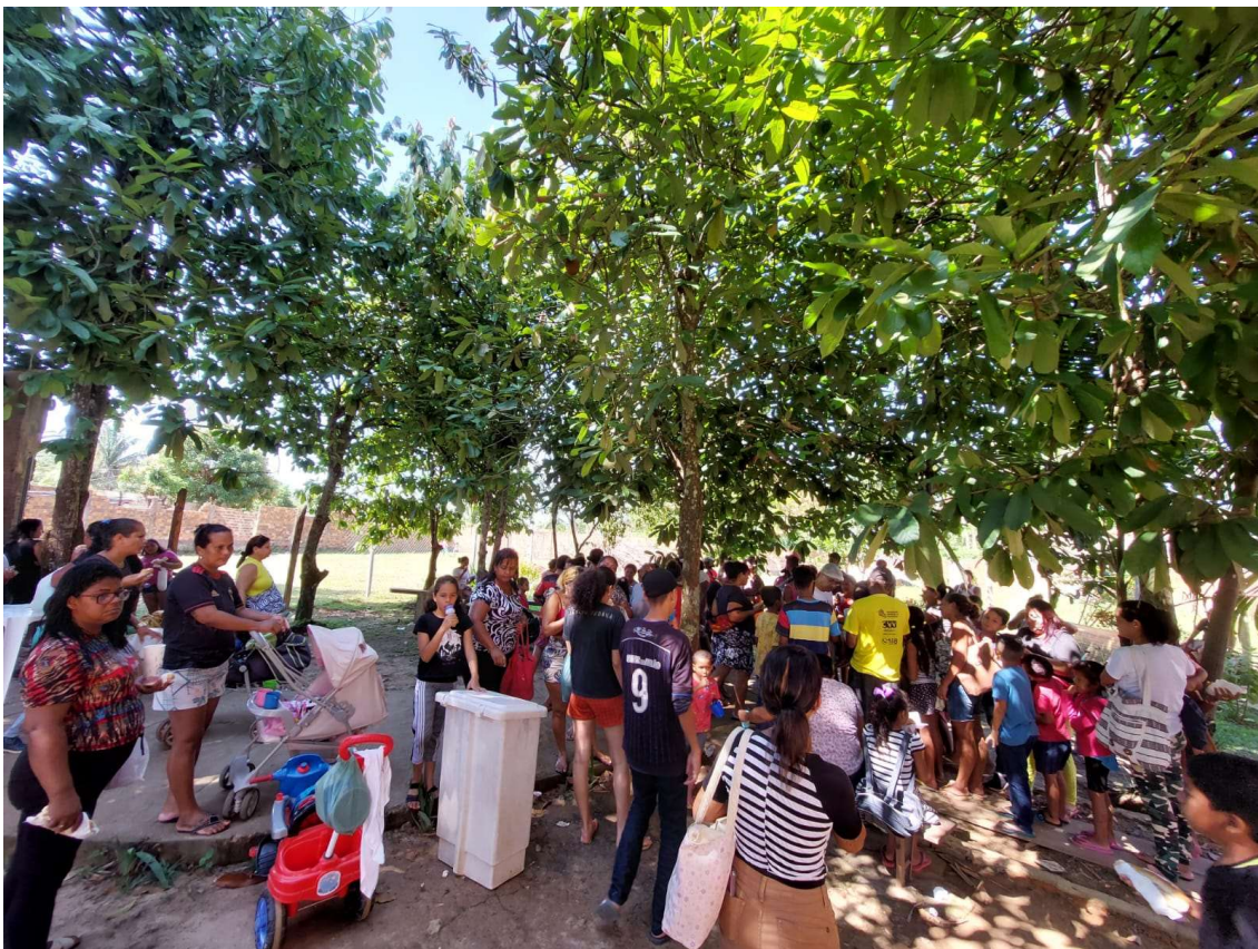
Doação de sopa