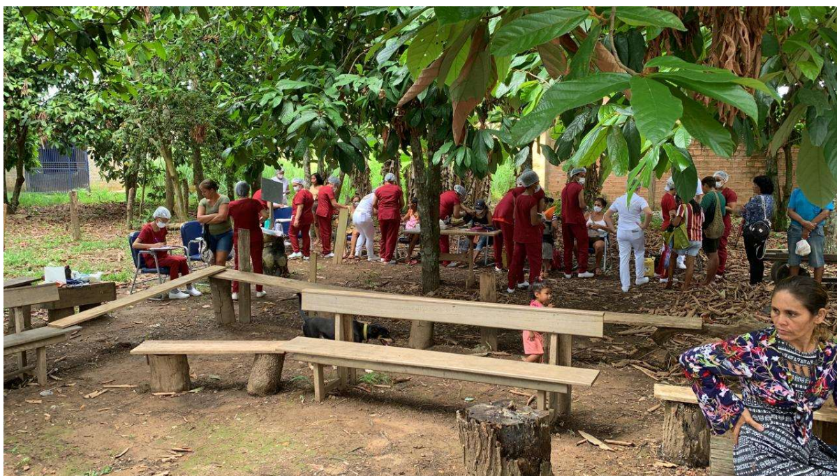
Atendimento de saúde