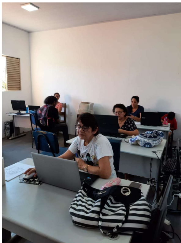
Sala de informática