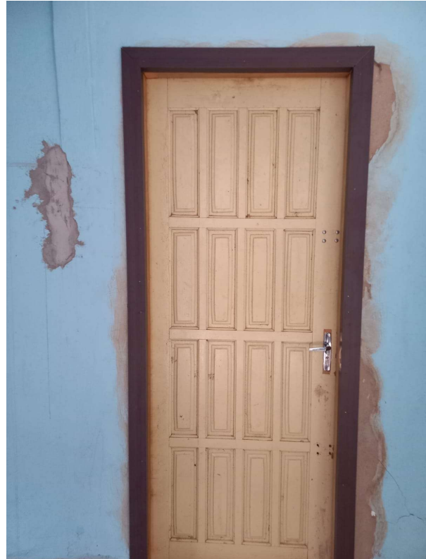
Grupo operacional de manutenção e pequenas reformas