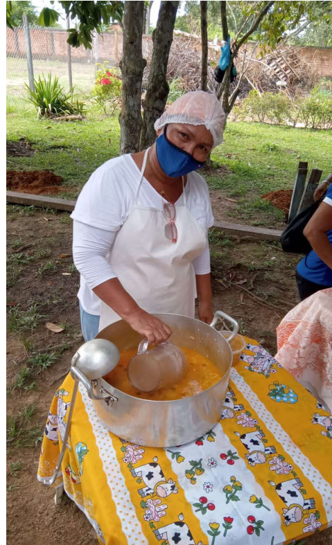
Doação de sopa