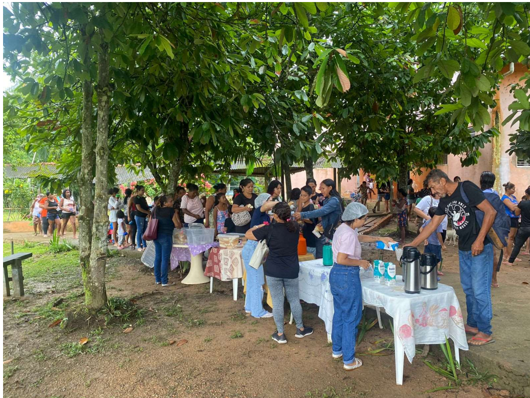
Café da manhã