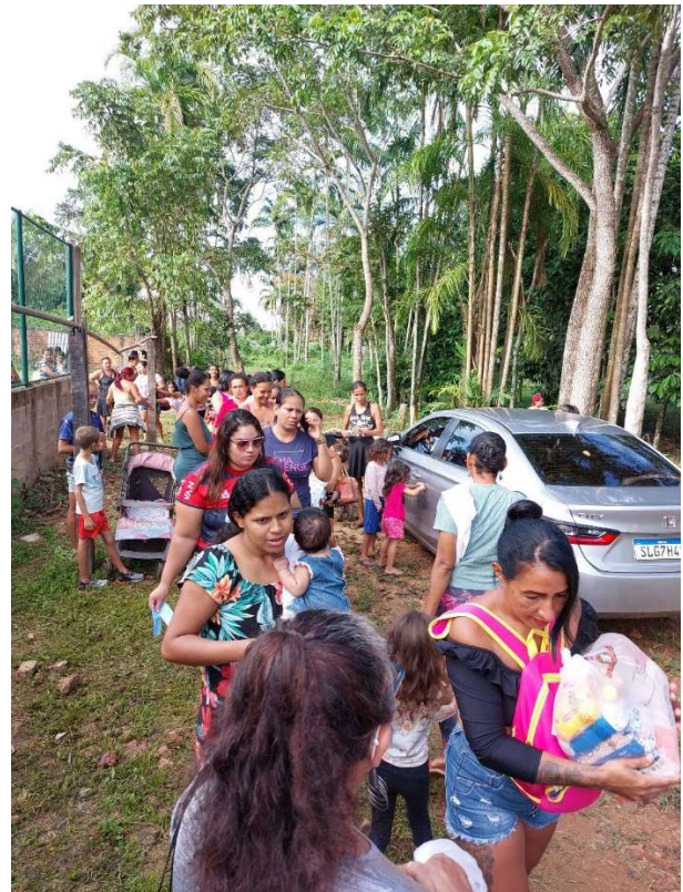
Doação de cestas básicas