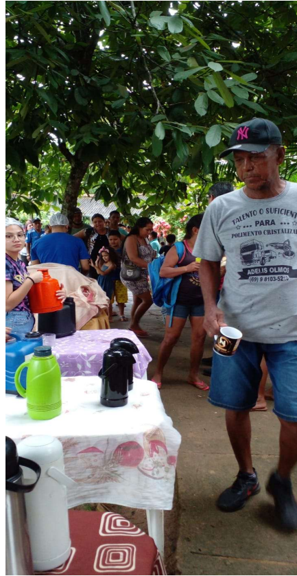
Café da manhã